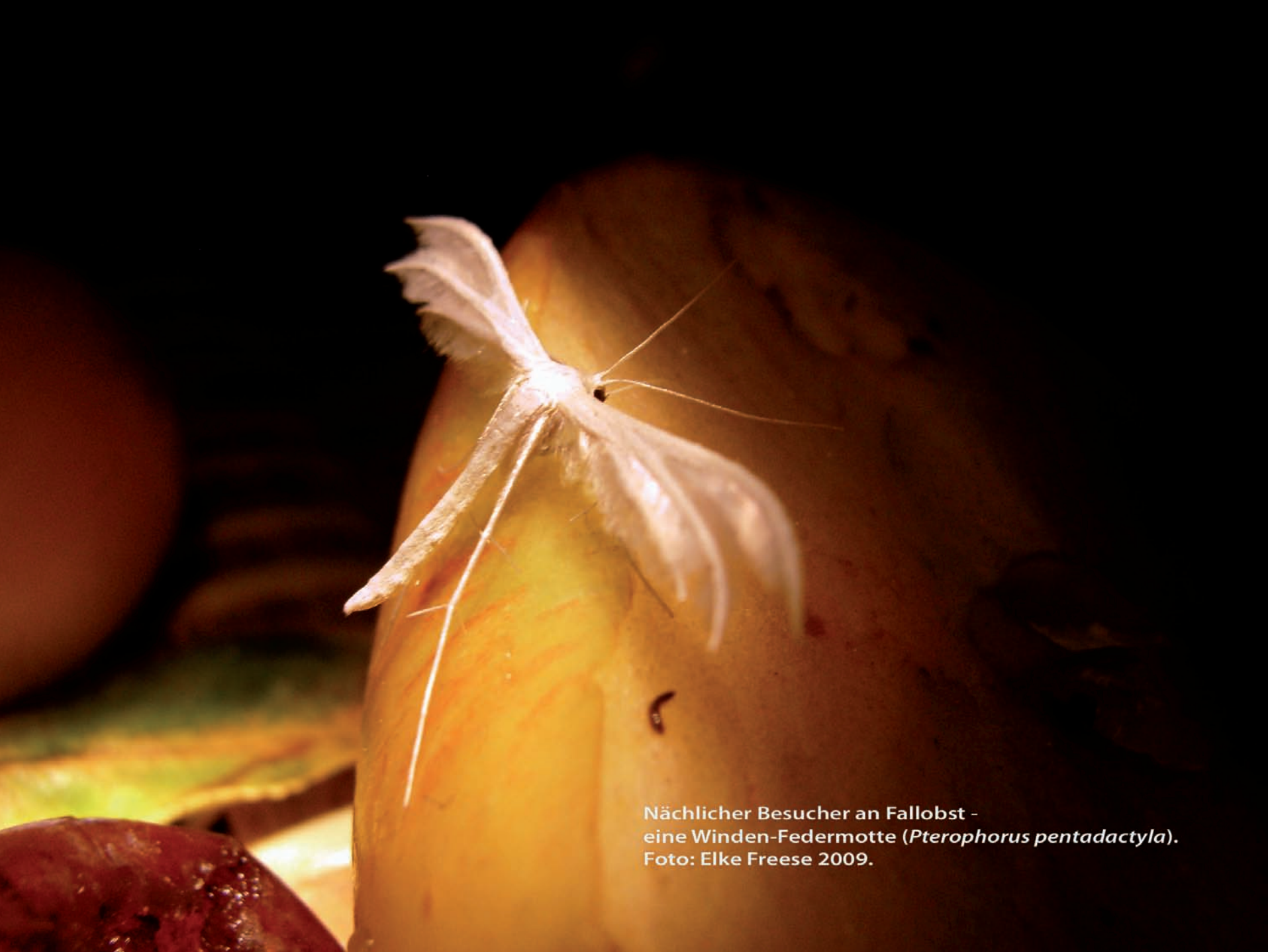
Nächlicher Besucher an Fallobst - eine Winden-Federmotte ( Pterophorus pentadactyla ). Foto: Elke Freese 2009.